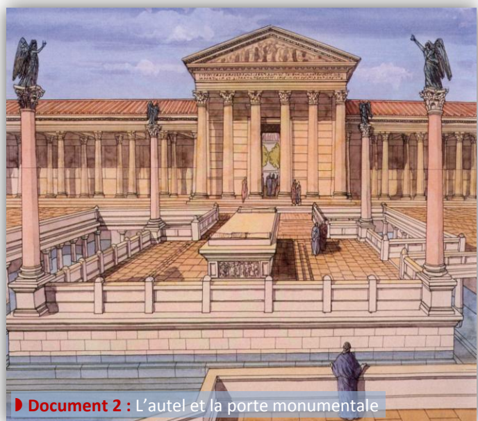
Document 2 : L'autel et la porte monumentale